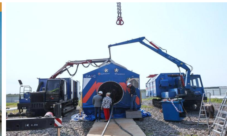
Комплекс автоматической лазерной сварки трубопроводов

Обеспечивает локализацию критической инфраструктуры сохраняя функциональность