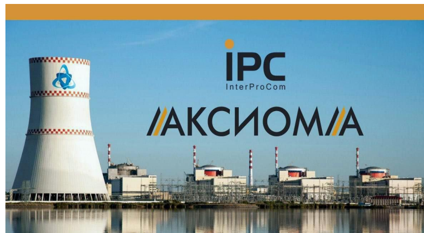
ПО для обеспечения управления процессами на атомных станциях

Превосходит аналог по грузоподъемности, массе и по ряду ключевых характеристик