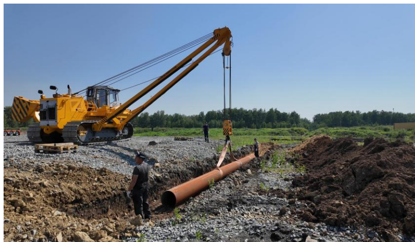
Линейка кранов-трубоукладчиков для нефтегазовой отрасли

Объем подтвержденного заказа по заключенным договорам