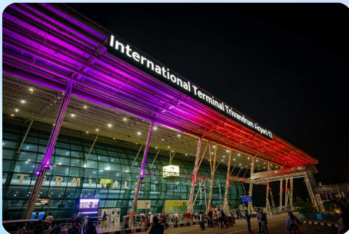
Аэропорт г. Тривандрум: Trivandrum International Airport.

Для творческих групп организован централизованный трансфер и будут работать шаттлы (Аэропорт- Гостиница-Площадка-Гостиница-Аэропорт).